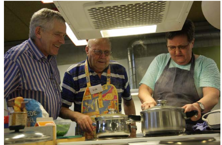
Madlavning for enkemænd