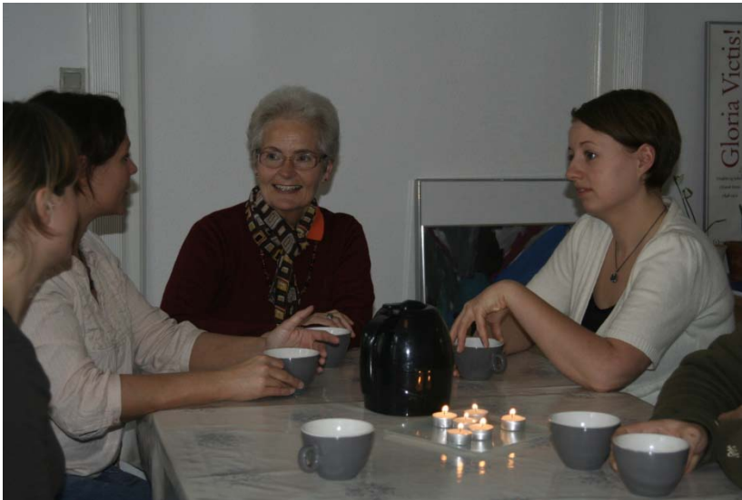
Møde i selvhjælpsgruppe (modelfoto)