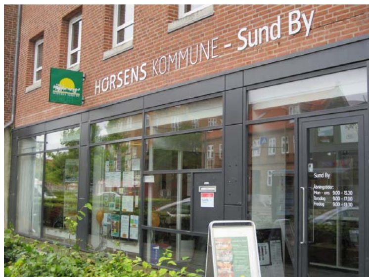
Sund By Butikken Åboulevarden 52