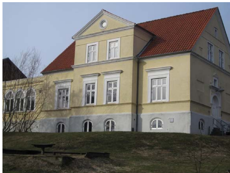
Selvhjælpsgrupper Kildegade 27B, 1. sal