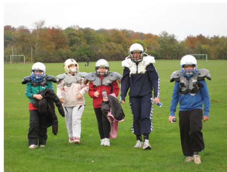
Motion er Fedt for børn 9-13 år